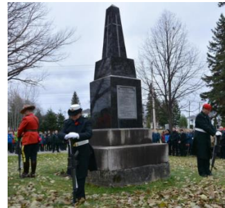
La Nouvelle de la 276